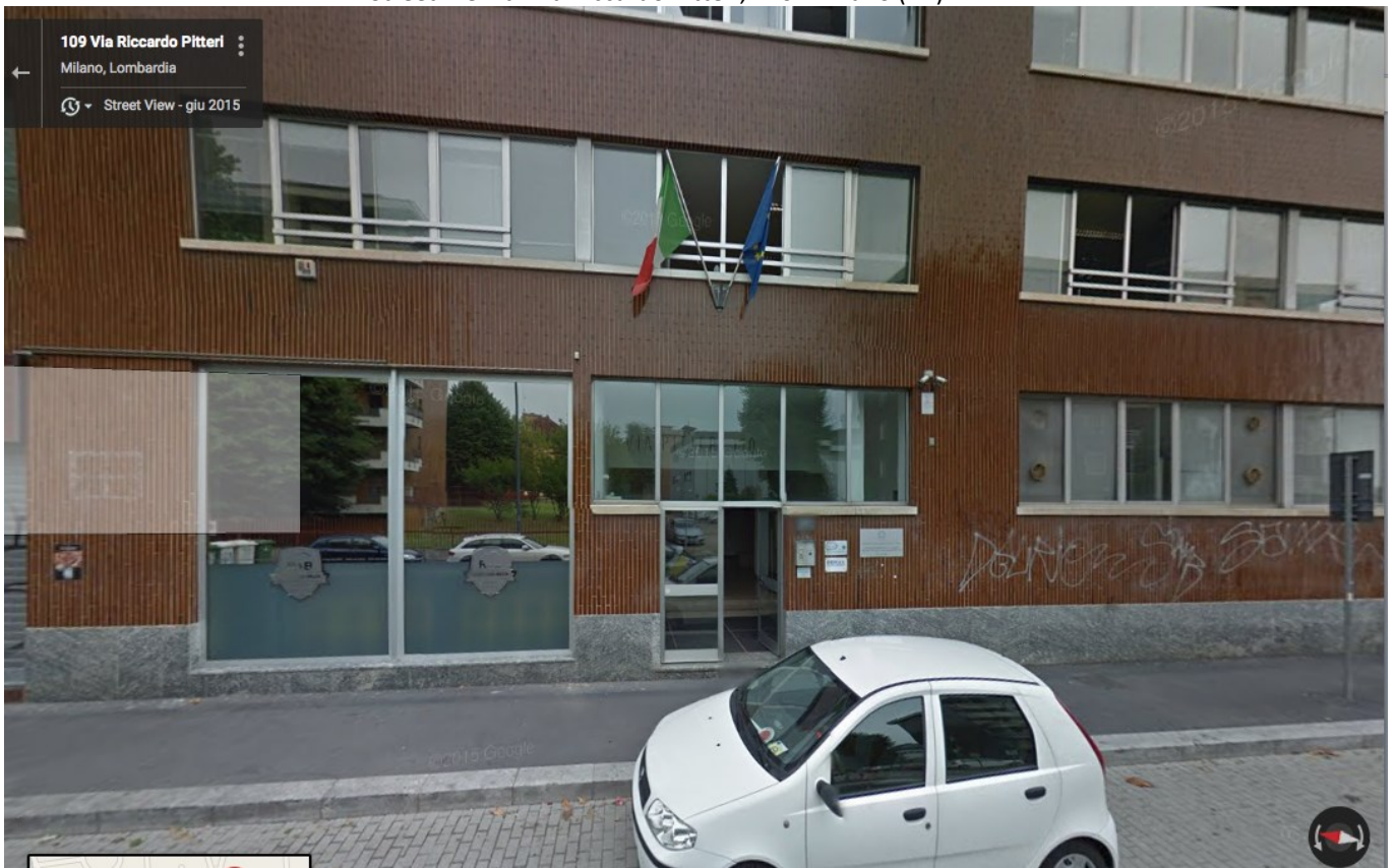
Street View di Via Riccardo Pitteri, 110 - Milano (MI)

Per tutti gli autobus, scendere alla seconda fermata “Console Flaminio - Saccardo” e all’incrocio attraversare la strada, imboccare Via Saccardo e proseguire per circa 300 mt (agenzia BNL sull’angolo e più avanti sulla destra chiesa di mattoni rossi e poi ufficio postale) fino ad una rotonda; alla rotonda svoltare a destra su via Pitteri, e proseguire per 50 mt. fino al civico 110.